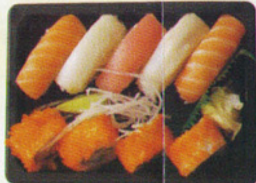
BOX 3 5€