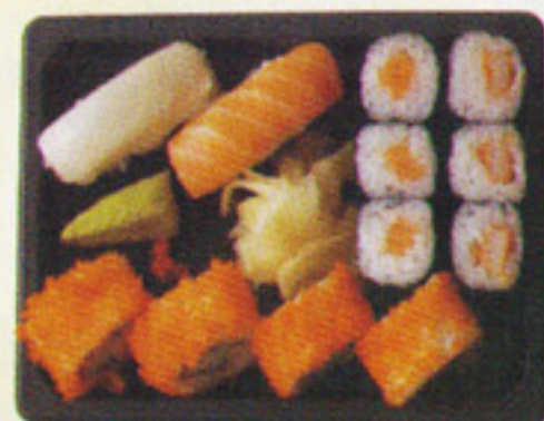
BOX 2 3€