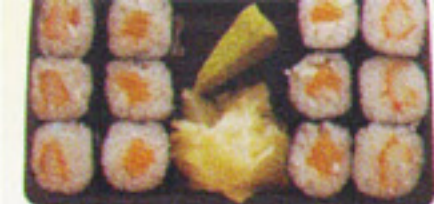
BOX 1 3€