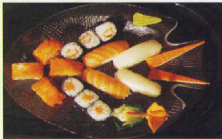
MENÜ 4 Shiga 7,70€ 6St. Maki, 4 Inside Out ,4 Nigiri Sushi