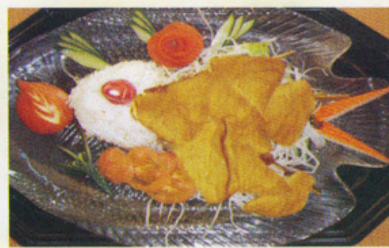
MENÜ 3 Tofu 6€ Tofu mit Reis und Salat