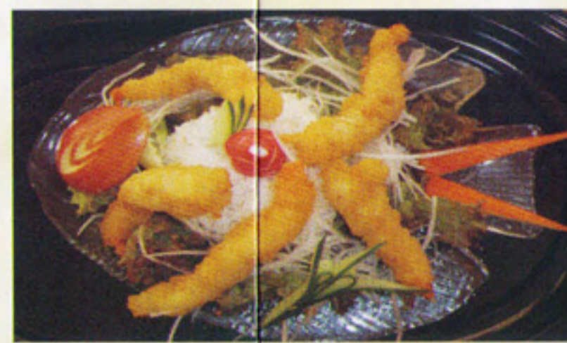
MENÜ 2 Ebi Tempura 7€ Großgarnelen paniert mit Reis u. Salat