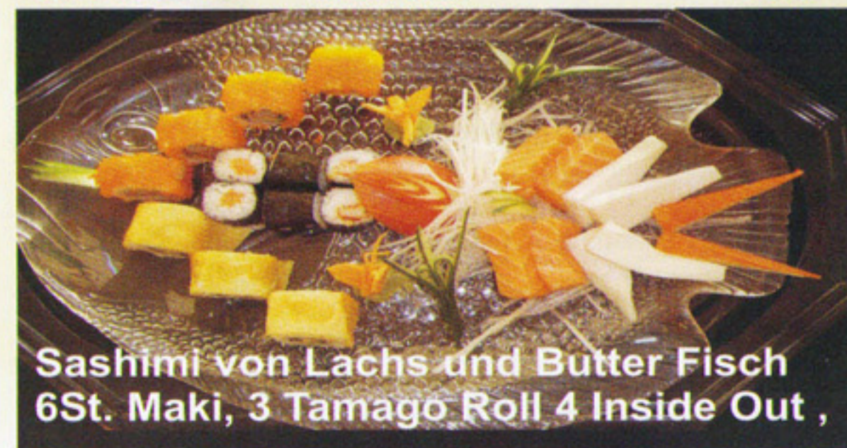
Sashimi von Lachs und Butter Fisch 6St. Maki, 3 Tamago Roll 4 Inside Out ,

Alle Menü von 11.00 - 17.00 Uhr incl. Miso Suppe + Tee + Desert