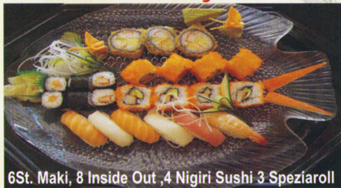
6St. Maki, 8 Inside Out ,4 Nigiri Sushi 3 Speziaroll