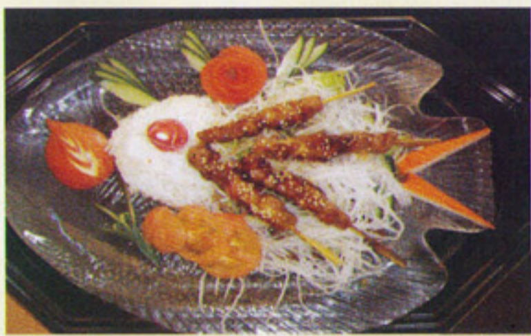
MENÜ 1 Yakitori 6€ Hähnchenspieß mit Reis u. Salat