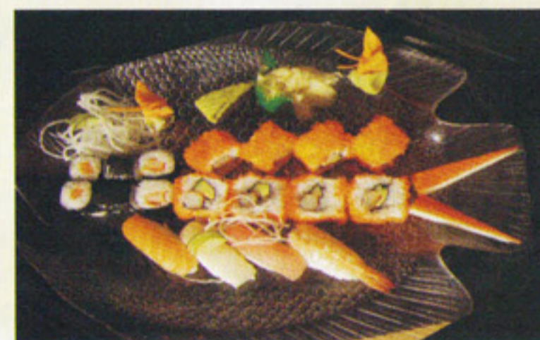
MENÜ 5 Akita 9,70€ 6St. Maki, 8 Inside Out ,4 Nigiri Sushi

Alle Menü von 11.00 - 17.00 Uhr incl. Miso Suppe + Tee + Desert